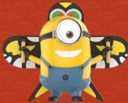
FLYING HIGH -STUART