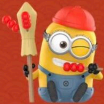
CANDIED HAWTS -TOM