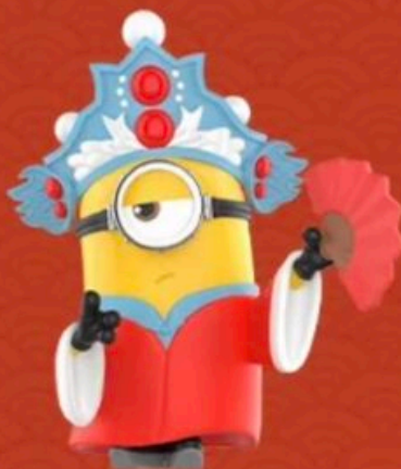
PEKING OPERA -STUART