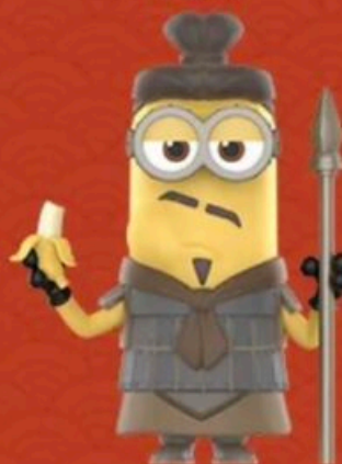
TERRACOTTA WARRIOR -KEYIN