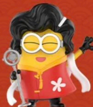
SHANGHAI SINGING -TOW