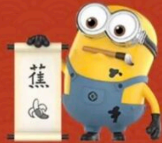
CHINESE CALLIGRAPHY -DAYE