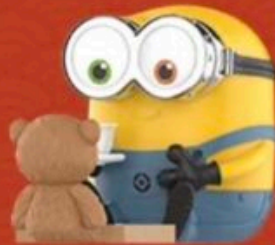
GAME OF GO-BOB