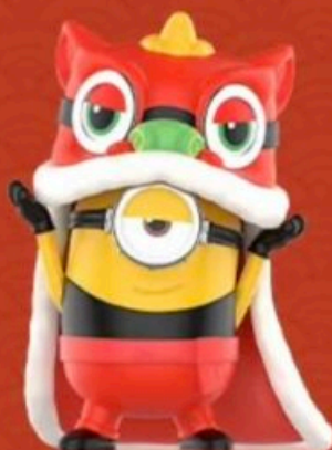
LION DANCE -STUART