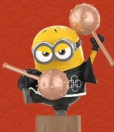
KUNGFU HAMMER -PHIL