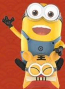
TIGER RIDING -DAVE